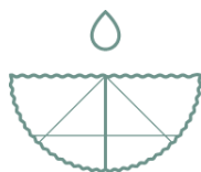
ACHTSAMKEIT & PFLEGE SILVANER

Ein Gefühl von Leichtigkeit und Beweglichkeit spüren, sich innerlich und äußerlich gereinigt und befreit fühlen. Werfen Sie alten Ballast ab, machen Sie sich frei von einengenden Denkmustern und auferlegten Zwängen und seien Sie offen für Neues. Die Weine mit diesem Piktogramm, der wohl bekanntesten und beliebtesten Rebsorte der Region Rheinhessen, runden Ihr Wellnesserlebnis ab und bringen Sie auf den richtigen Weg.