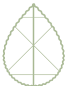
REINIGUNG & FRISCHE RIESLING

Sich gestärkt fühlen, in Bewegung kommen, voller Energie sein und in seine Kraft finden. Stärke kommt von Innen. Es ist uns ein Anliegen die Kraft Ihrer Seele zu fördern, indem Sie bei Ihrem Wellnesaufenthalt bei uns neue Energie tanken. Ergänzt durch unsere Spätburgunder Weine mit diesem Piktogramm vervollständigen wir Ihre Bedürfnisse nach Kraft & Energie.