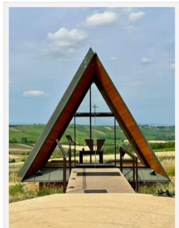
Die Kapelle in den Weinbergen

Sollte es dich doch eher in eine Stadt ziehen, kannst du dir zum Beispiel Mainz, Worms und Bingen in der Nähe anschauen.