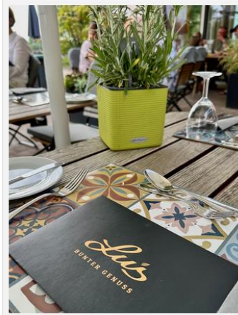
Lu's Bunter Genuss heisst das Restaurant