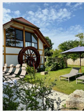
Entspannung im großen Garten