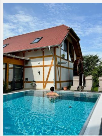
Der große Outdoorpool

Der beheizte Outdoorpool kann durch den Inneneinstieg oder vom großen Garten mit den Relax-Liegen aus genutzt werden.