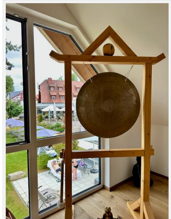
Vom Yogaraum blickt man in den Garten

Täglich (außer sonntags) finden hier um 11.00 Uhr Yogastunden statt, für die man sich vorher anmelden muss (die Teilnahme ist im Preis bereits enthalten). Wechselnde Yogalehrer unterrichten von Ashtanga über Hatha, Kundalini und Vinyasa bis hin zu Yin Yoga verschiedene Stilrichtungen.