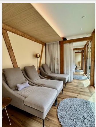
Einer der vielen Ruheräume