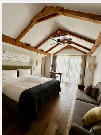
Die Zimmer sind hell und gemütlich