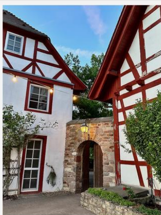
Der charmante Fachwerkcharakter blieb erhalten

Jordan's Untermühle ist eine Oase für Ruhesuchende und alle, die gerne genießen und entspannen.