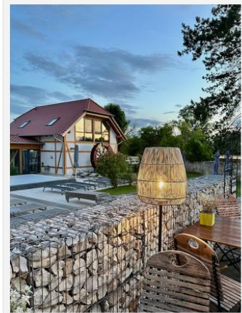
Abendstimmung auf der Sonnenterrasse

Bei der Erweiterung 2018 wurde neben dem Hotelanbau auch der 1.000 Quadratmeter große Wellnessbereich, das Herz & Rebe Spa, errichtet.