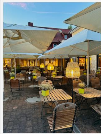
Im Sommer wird auf der Terrasse serviert

Seit Juni 2023 bringt sie die Erfahrungen der Sterneküchen zurück in ihre Heimat und leitet das nach ihr benannte Restaurant „Lu`s Bunter Genuss“.