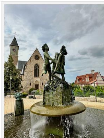
Der Drei-Grazien-Brunnen in Zornheim

Am nächsten Tag ging's zu Fuß in die Weinberge auf eine Hiwweltour. Hiwwel heißt Hügel und die Touren sind typisch für die Region. Wir sind die Hiwweltour Zornheimer Berg gewandert – auf und ab ging es auf wunderschönem Gelände durch die Weinberge. Der Rundweg startet am Drei-Grazien-Platz in Zornheim. Für die 6,8 km benötigten wir etwa zwei Stunden.