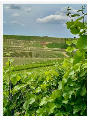
Wanderung durch die Weinberge