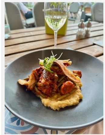
Auch vegetarische Gerichte stehen zur Wahl

Ihre Gerichte sind kreativ und interpretieren traditionelle Speisen mutig und neu. Beim abendlichen Drei-Gang-Menü haben die Gäste für den Hauptgang die Wahl aus einem vegetarischen, einem Fisch- und einem Fleischgericht. Das kann auch mal Fasan oder Kaninchen sein.