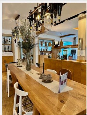
Hier gibt's kostenlos Getränke und Obst

An den Getränkestationen kann man mit Detox-Wasser und Tee die leeren Tanks wieder auffüllen.