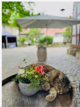
Hier fühlt sich auch die Hauskatze wohl