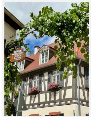
Im schönen Bodenheim

Am nächsten Tag ging's zu Fuß in die Weinberge auf eine Hiwweltour. Hiwwel heißt Hügel und die Touren sind typisch für die Region. Wir sind die Hiwweltour Zornheimer Berg gewandert – auf und ab ging es auf wunderschönem Gelände durch die Weinberge. Der Rundweg startet am Drei-Grazien-Platz in Zornheim. Für die 6,8 km benötigten wir etwa zwei Stunden.