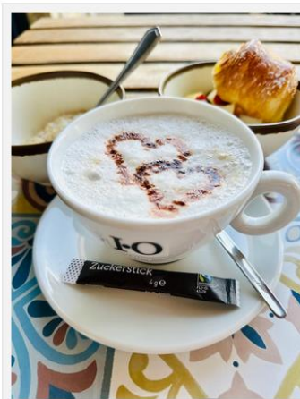
So kann der Tag beginnen

Köstlich fanden wir auch das frisch gebackene Brot und den hausgebeizten Lachs beim umfangreichen und leckeren Frühstücksbuffet.