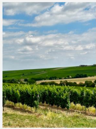
Durch die Weinberge