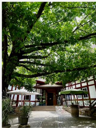
Der Eingang im schönen Innenhof

Das Genuss- und Wellnesshotel befindet sich seit 2005 im Besitz der Familie Jordan. Drei historische Fachwerkhäuser aus dem 17. Jahrhundert und die alte Wassermühle bilden zusammen mit dem modernen Anbau eine charmante Anlage.