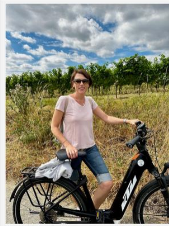
Mit dem E-Bike unterwegs

Das Hotel verleiht sogar E-Bikes (gegen Gebühr), mit denen du prima die Gegend erkunden kannst. Wir haben uns für die Amiche Tour entschieden. Auf dem 33 km Rundweg haben wir -neben jeder Menge Weinberge- den schönen Weinort Bodenheim und Nierstein am Rhein gesehen.