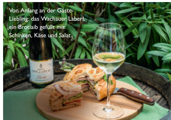
Von Anfang an der Gästeliebling: das Wachauer Laberl, ein Brotlaib gefüllt mit Schinken, Käse und Salat