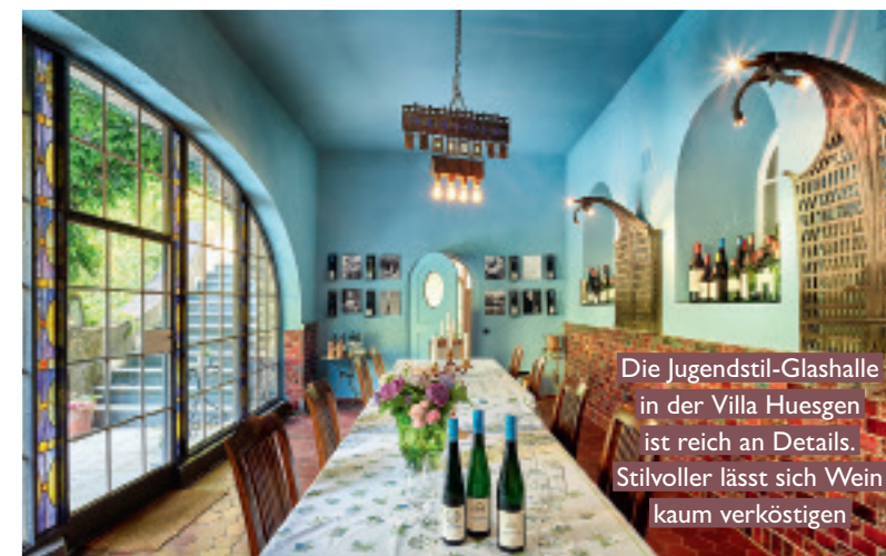
Die Jugendstil-Glashalle in der Villa Huesgen ist reich an Details. Stilvoller lässt sich Wein kaum verköstigen