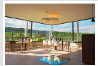
Bei einer Verkostung in der Vinothek ist man ganz nah dran am Weinberg

INFO Verkostung und Weinverkauf Mo-Fr von 8–12 Uhr und 13–18 Uhr. Sa 9–16 Uhr, Adresse: Weingut Karl-Heinz Gaul, Bärenbrunnenstr. 15, 67269 Grünstadt-Sausenheim, Tel.: 063 59/8 45 69, www.weingut-gaul.de