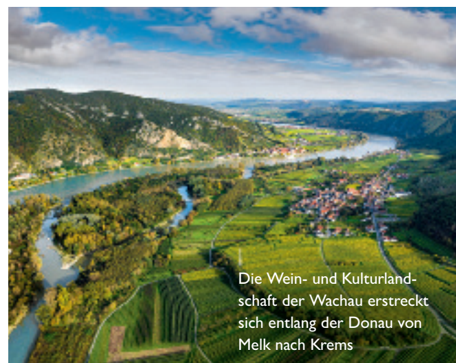
Die Wein- und Kulturlandschaft der Wachau erstreckt sich entlang der Donau von Melk nach Krems

INFO Für Weingartenwanderungen und Radtouren gibt es spezielle Jausenkorbchen zum Mitnehmen mit gekühltem Wein und bruchsicke Geschirr. Außer Mi und Do täglich ab 11 Uhr geöffnet. Adresse: Weingut Holzapfel, Prandtauerplatz 36, A-3610 Weißenkirchen i. d. Wachau, Tel.: 0043/(0)27 15/23 10, www.holzapfel.at