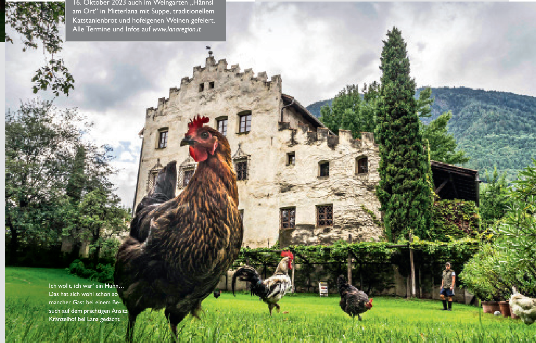
Ich wollt, ich wär' ein Huhn... Das hat sich wohl schon so mancher Gast bei einem Besuch auf dem prächtigen Ansitz Kränzelhof bei Lana gedacht