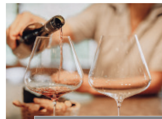
Weißer und rote Burgundersorten sind die Paradegevächse der Weinmanufaktur Kränzelhof

INFO Von April bis Ende September tägl. von 9.30–19.00 Uhr geöffnet. Es gibt vinosophische Führungen sowie verschiedene kulinarische Angebote. Adresse: Kränzelhof, Gampenstr. 1, I-39010 Tschermers, Tel.: 0039/04 73/56 45 49, www.kraenzelhof.it