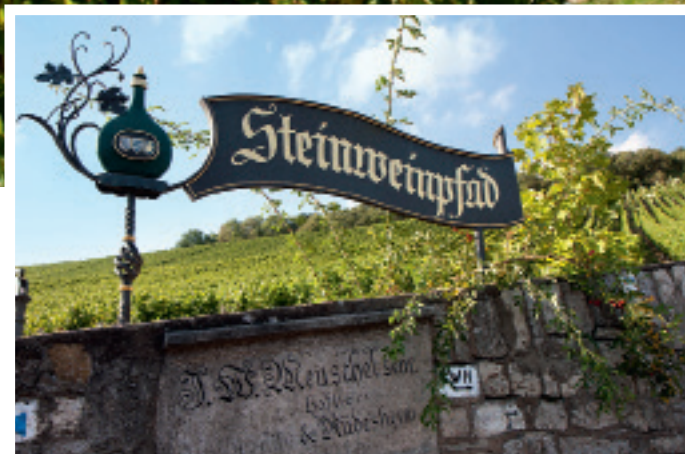
Direkt oberhalb des Weinguts startet der rund fünf Kilometer lange Panoramaweg „Steinweinpfad“