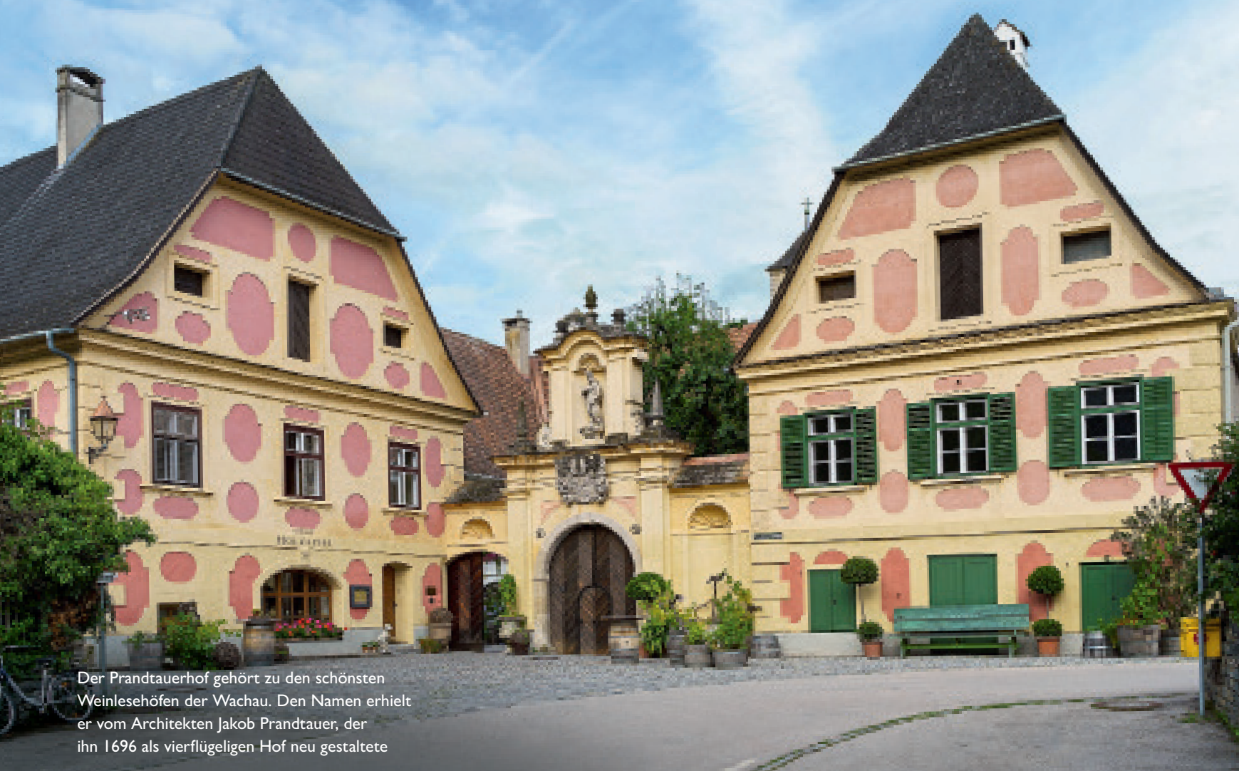
Der Prandtauerhof gehört zu den schönsten Weinlesehöfen der Wachau. Den Namen erhielt er vom Architekten Jakob Prandtauer, der ihn 1696 als vierflügeligen Hof neu gestaltete