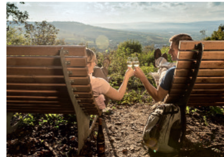
In Deutschlands größtem Weinanbaugebiet Rheinhessen finden sich jede Menge bildschöne Plätze, um dem Genuss zu frönen