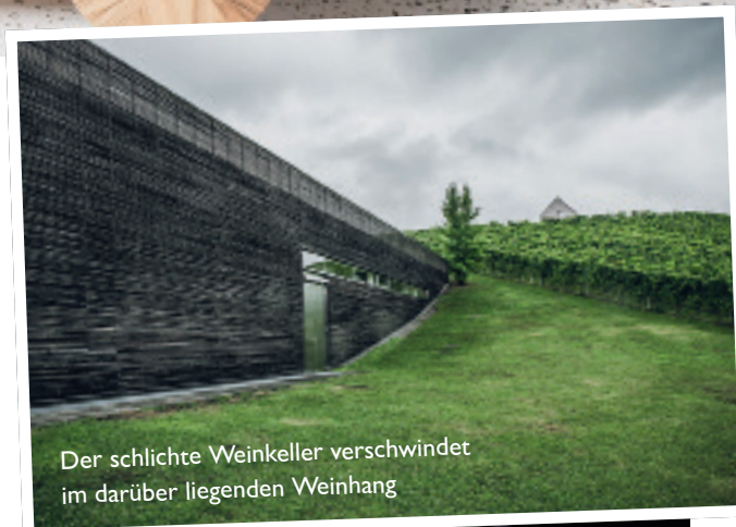
Der schlichte Weinkeller verschwindet im darüber liegenden Weinhang

INFO Das Weingut hat von Montag–Samstag 10–17 Uhr geöffnet. Auf Anfrage werden auch Führungen angeboten. Adresse: Weingut Lackner-Tinnacher, Steinbach 12, A-8462 Gamlitz, Tel.: 0043/(0)34 53/21 42, www.tinnacher.at