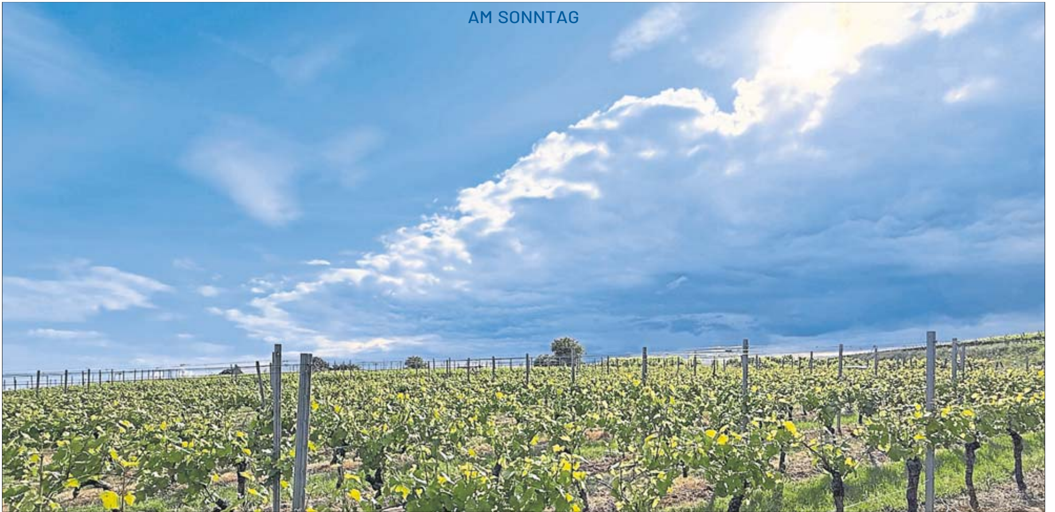
Rheinbessen zählt zu den sonnenreichsten und trockensten Gegenden Deutschlands.